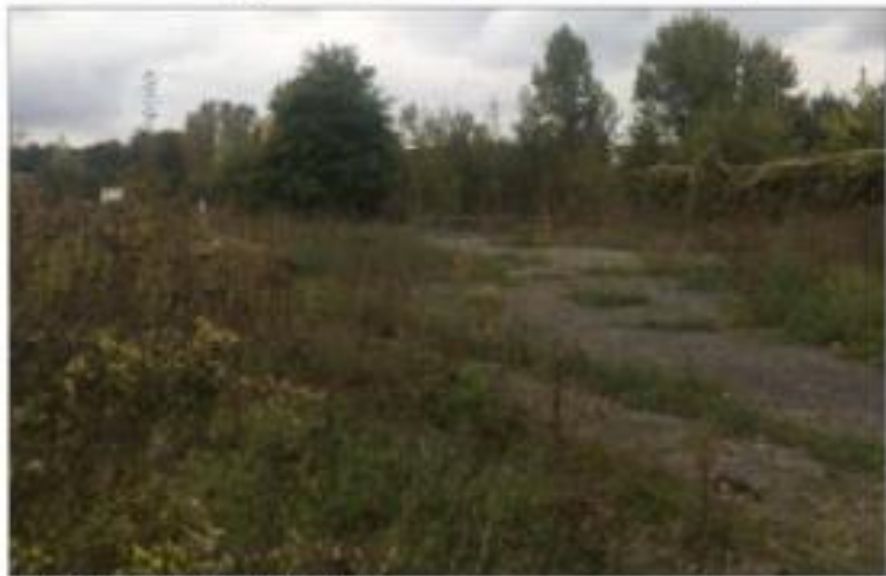
Les friches des Forges de Commercy.

Il s'agit de « pouvoir répondre aux besoins des entreprises de la Codecom et de leur permettre de trouver les actifs