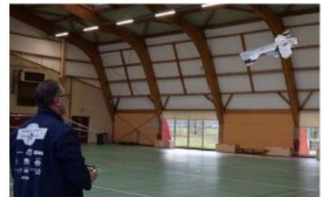
La reprise des rencontres interclubs indoor d'aéromodélisme a eu lieu dimanche dernier à Vignot.

Depuis la période de Covid, les rencontres d'aéromodélisme indoor de l'AMCC (Aero Model Club Commercy) avaient cessé. La reprise a eu lieu ce dimanche 26 janvier à la salle polyvalente des Ouilons de Vignot, où plusieurs clubs étaient présents, dont ceux de Verdun, Vitry-le-François, Chambley, Chaumont, Nancy, et bien entendu celui de l'AMCC de Commercy.