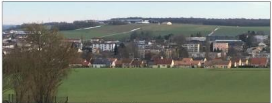
Un lotissement sacrifié au nom de la limitation de la consommation foncière.

À ce stade, s'il est encore trop tôt pour entrer dans les détails, trois grands axes ont été définis : renforcer l'armature terr-