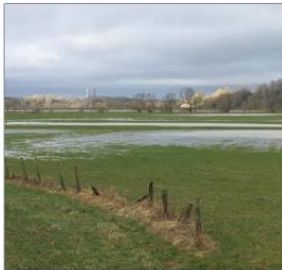
La Meuse entre Commercy et Vignot...

C'est au nom de ces objectifs de transition écologique, que l'Etat impose une réduction drastique de 50 % de la consommation foncière, avec pour objectif la ZAN (zéro artificialisation nette) d'ici à 2043 qui obligera la Codecom et les communes à revoir tous leurs plans