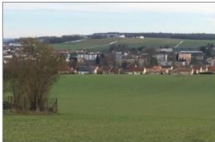
Corvée aux Moines : un projet de lotissement revu à la baisse.

Premier effet : l'Etat demande aux territoires de réduire de 50 % la consommation des espaces naturels, agricoles et forestiers. Cela