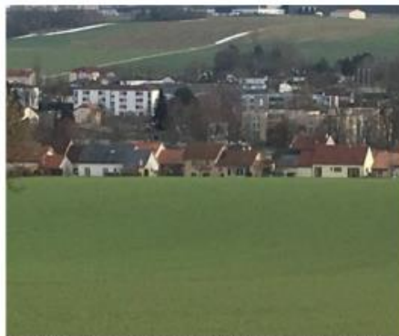
Le schéma de cohérence territoriale sera-t-il adopté à l'automne?

Une dernière réunion publique de présentation est organisée ce lundi 3 février à 18 h 30 à la Maison des Services, 22 rue Louvière, à Void-Vacon. À cette occasion, seront présentées grandes lignes des documents finalisés du SCoT.